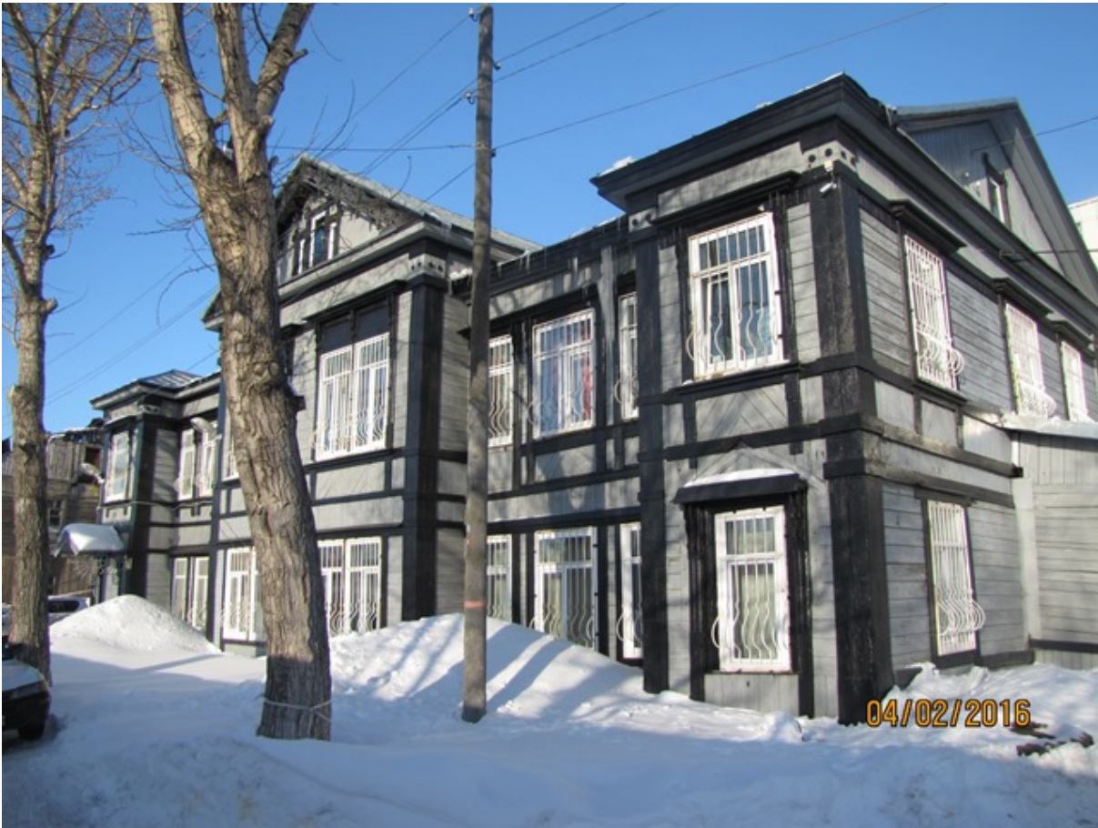
ФОТО № 3