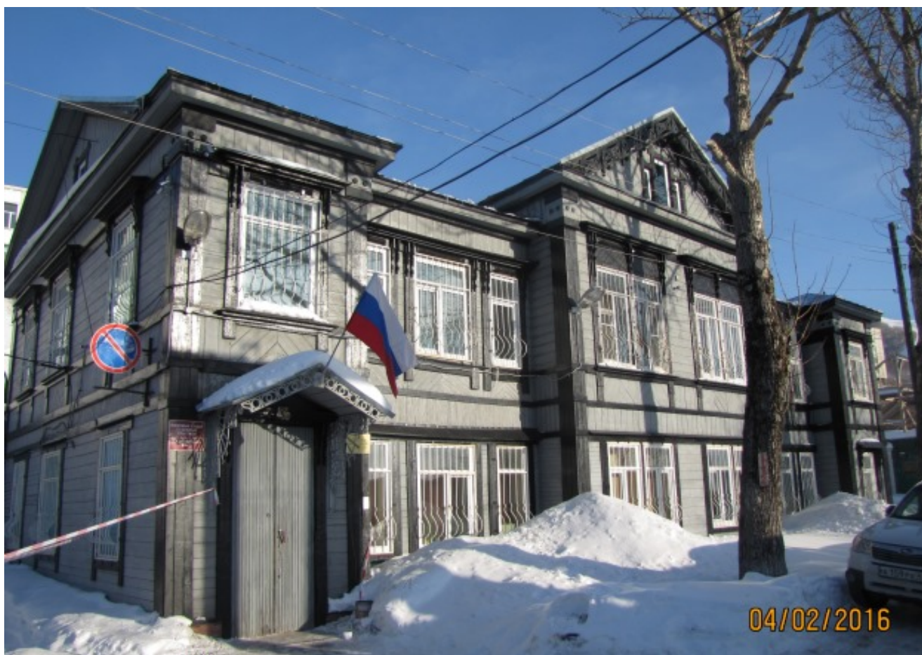
Фото № 1.

Фотографические изображения № 1 – 7 объекта культурного наследия регионального значения «Дом № 10 по ул. Красноармейской в г. Петропавловске-Камчатском», расположенного по адресу: Камчатский край, г. Петропавловск-Камчатский, ул. Красноармейская, 10 от 04 февраля 2016 года