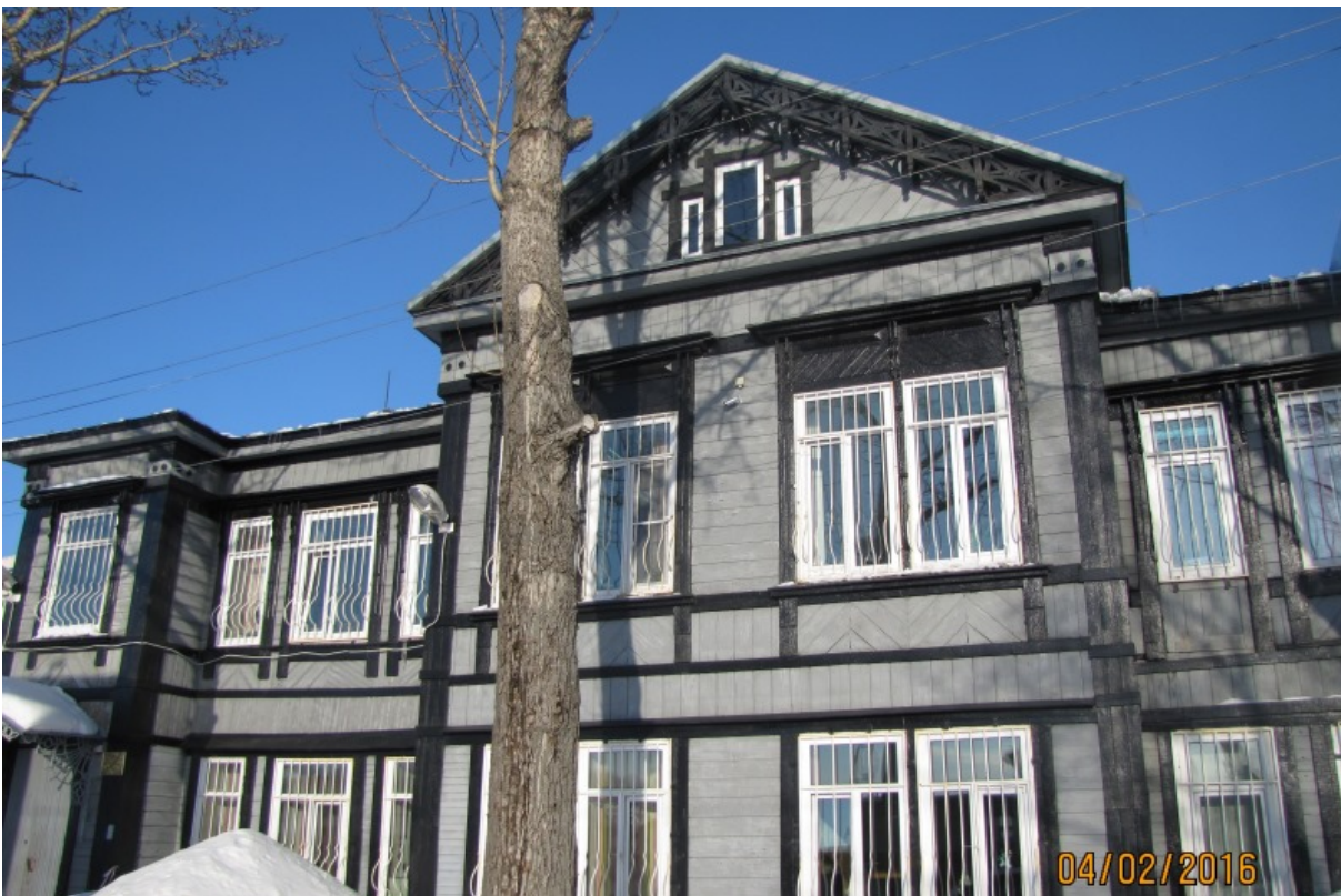
ФОТО № 4