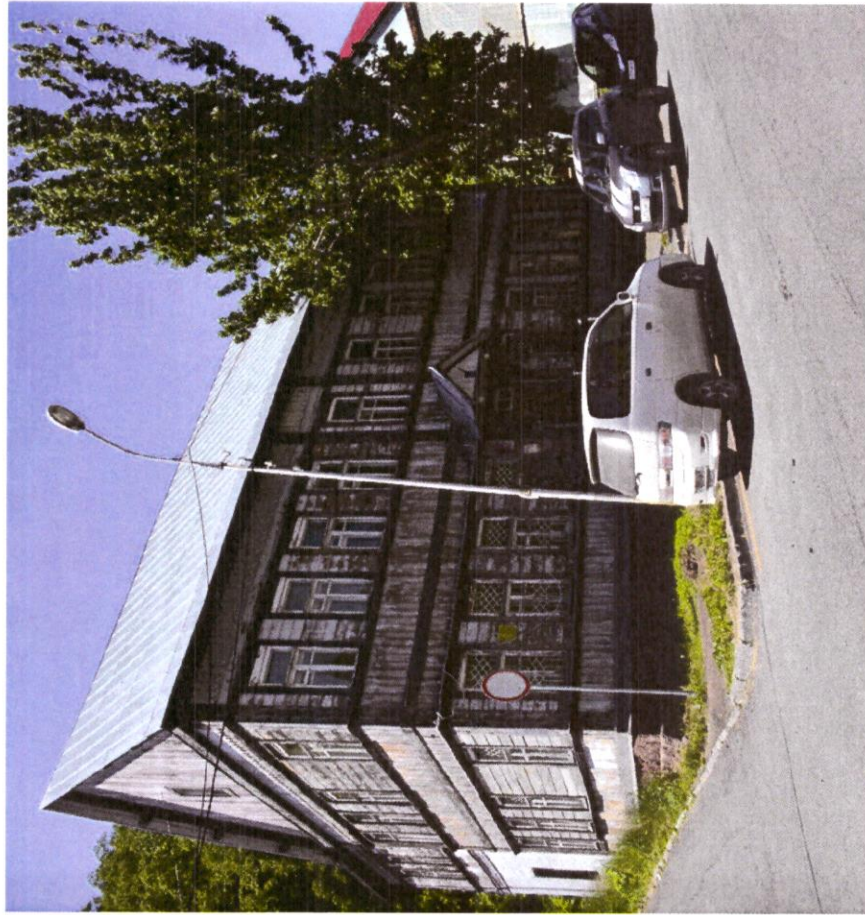
Фото № 1-2

к охранному обязательству собственника или иного законного владельца объекта культурного наследия регионального значения «Дом № 11 по ул. Красинцев в г. Петропавловске-Камчатском