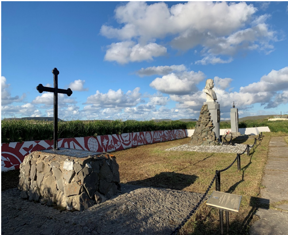
Фото № 1-2