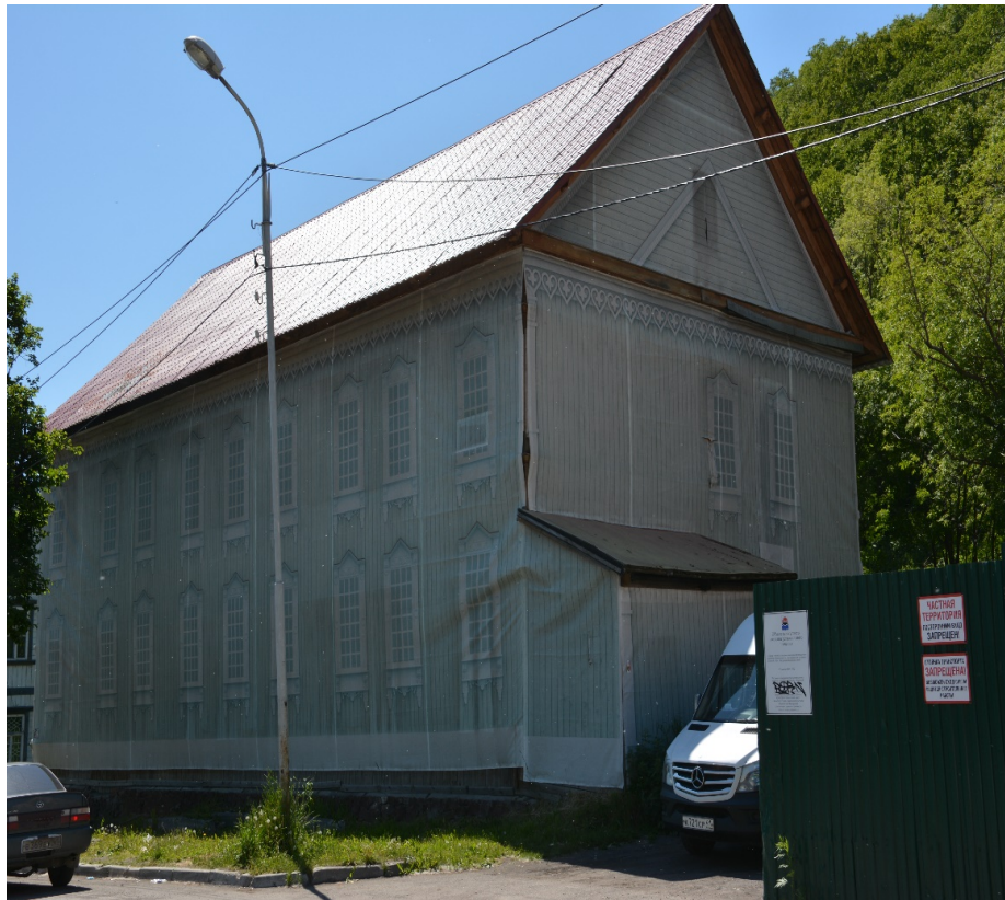
Фото № 1-2