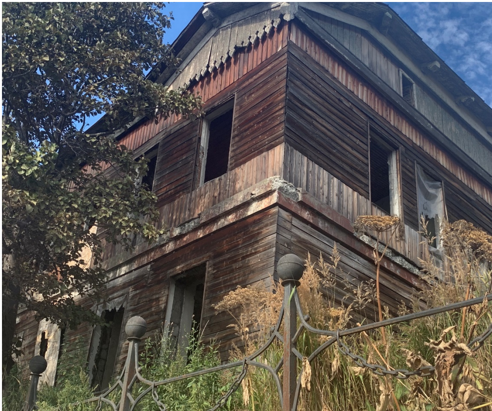
Фото № 1-2