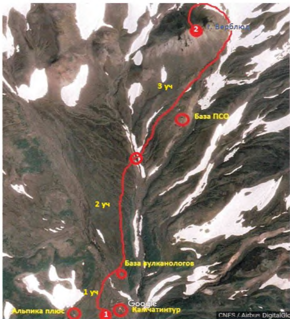
Рис. 2 Нитка пешего маршрута