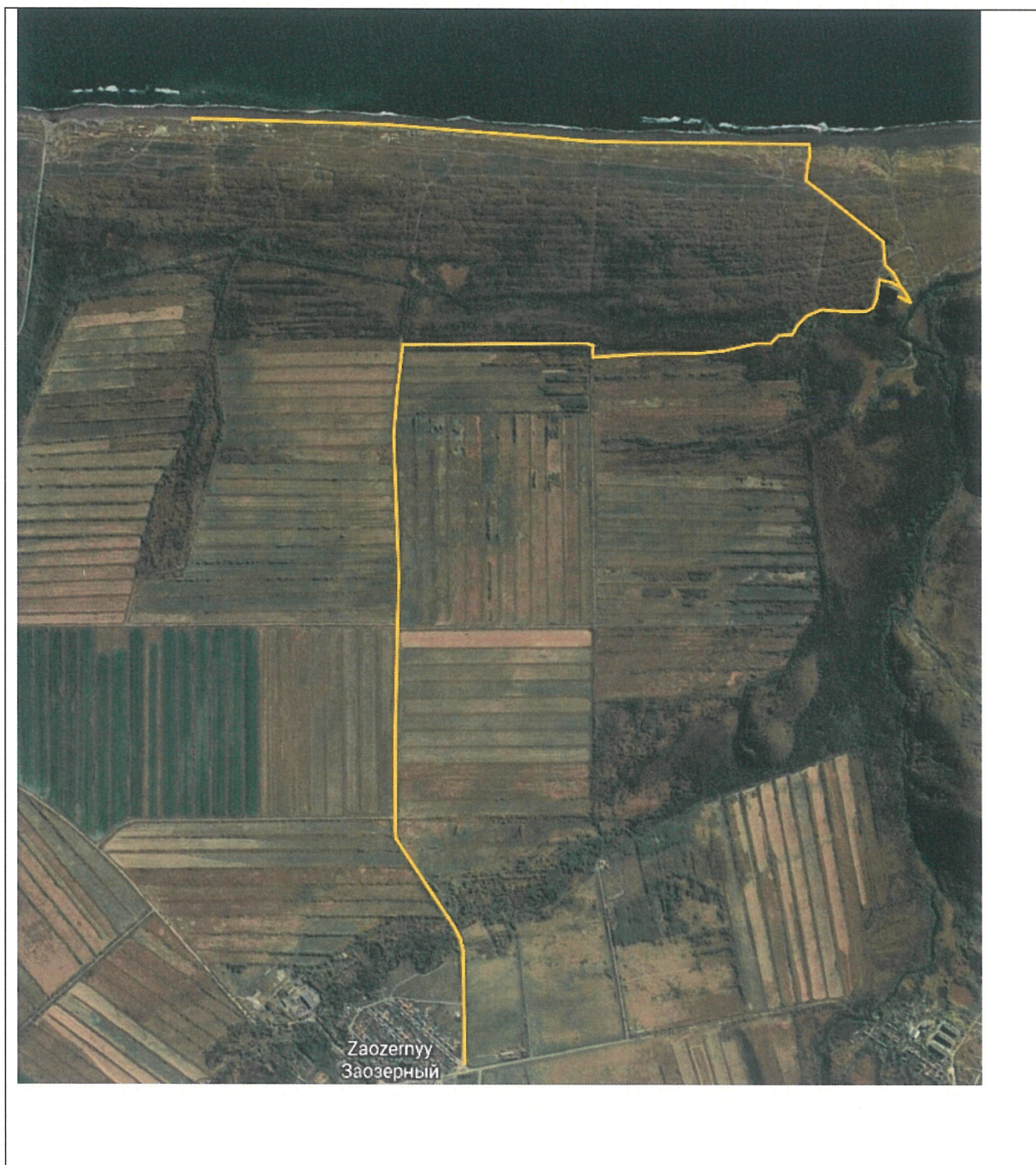
СХЕМА ТУРИСТСКОГО МАРШРУТА « _____ »