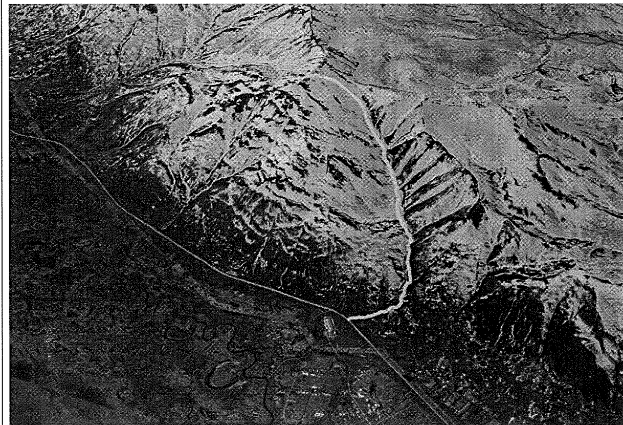
СХЕМА ТУРИСТСКОГО МАРШРУТА «гора Зайкин мыс (Чирельчик)»