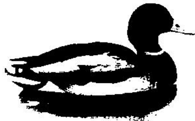
Селезень кряквы (Anas platyrhynchos)

Мы обращаемся к Вам с убедительной просьбой ответить на вопросы, приведенные на обороте этого листа. Ваши ответы помогут оценить объем добычи одного из самых популярных объектов охоты – кряквы. Пожалуйста, укажите точное количество отстрелянных Вами селезней кряквы по итогам весеннего сезона. Важны все результаты, поэтому заполните эту анкету даже в тех случаях, когда Вы получили разрешение на добычу селезней уток, но не охотились, или же Вам не удалось отстрелять ни одного селезня кряквы.