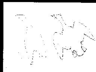
Пример 1: Варианты расположения