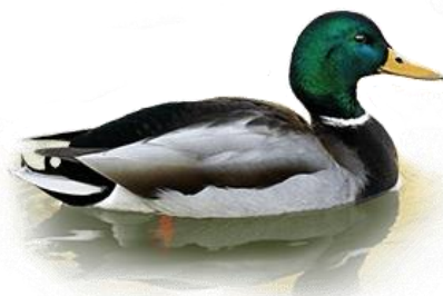
Селезень кряквы (Anas platyrhynchos)

Мы обращаемся к Вам с убедительной просьбой ответить на вопросы, приведенные на обороте этого листа. Ваши ответы помогут оценить объем добычи одного из самых популярных объектов охоты – кряквы. Пожалуйста, укажите точное количество отстрелянных Вами селезней кряквы по итогам весеннего сезона. Важны все результаты, поэтому заполните эту анкету даже в тех случаях, когда Вы получили разрешение на добычу селезней уток, но не охотились, или же Вам не удалось отстрелять ни одного селезня кряквы.