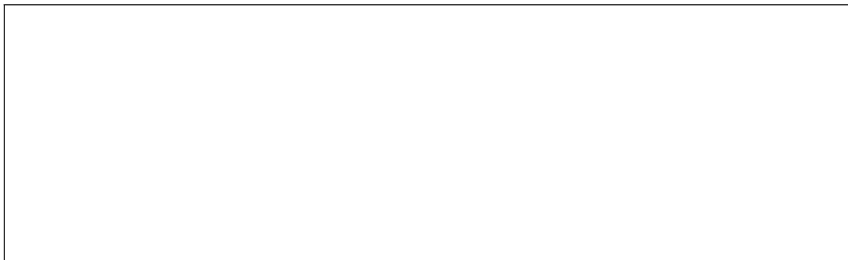
СХЕМА расположения земельного (лесного) участка с кадастровым номером

Копия выписки из Единого государственного реестра недвижимости об основных характеристиках и зарегистрированных правах на объект недвижимости