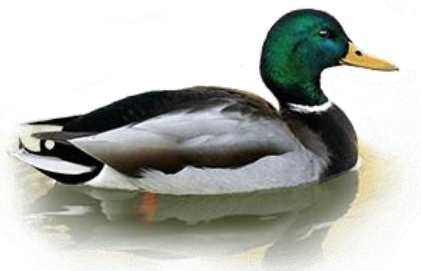
Селезень кряквы (Anas platyrhynchos)

Мы обращаемся к Вам с убедительной просьбой ответить на вопросы, приведенные на обороте этого листа. Ваши ответы помогут оценить объем добычи одного из самых популярных объектов охоты – кряквы. Пожалуйста, укажите точное количество отстрелянных Вами селезней кряквы по итогам весеннего сезона. Важны все результаты, поэтому заполните эту анкету даже в тех случаях, когда Вы получили разрешение на добычу селезней уток, но не охотились, или же Вам не удалось отстрелять ни одного селезня кряквы.