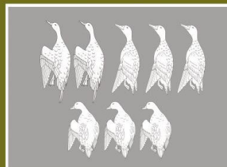
Пример 3: Группировка по внешнему виду