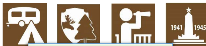
Указатели и пиктограммы