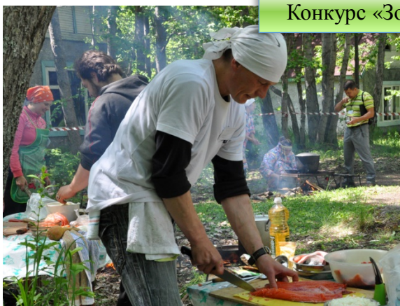
Конкурс «Золотой Котелок»

28 июня 2014 года в с. Пиначево на базе Камчатского клуба туристов имени Глеба Травина состоялся конкурс полевых поваров Камчатки «Золотой Котелок».