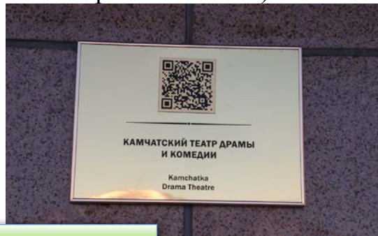
Таблички с QR-кодами