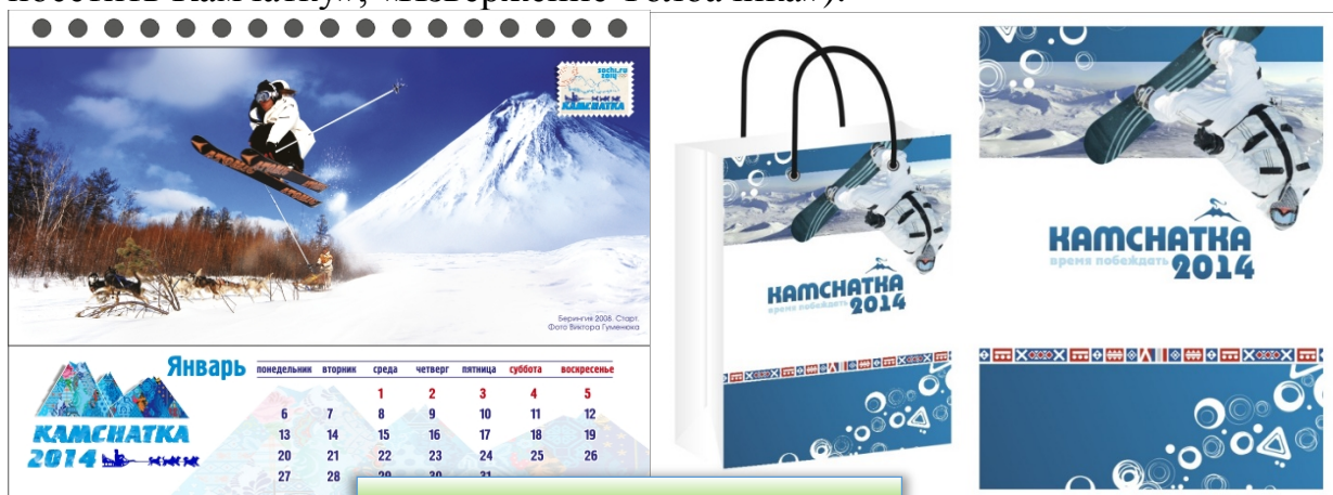
Календарь и пакеты

С тематикой Камчатского края изготовлены брелоки, значки, магниты керамические и полотно, фирменные подарочные пакеты, Z-карта на различных языках, календари, открытки, наклейки, справочники о Камчатке, флеш-карты и видеобуклеты с записью 3-фильмов («Journey to the other planet», «10 причин посетить Камчатку», «Извержение Толбачика»).