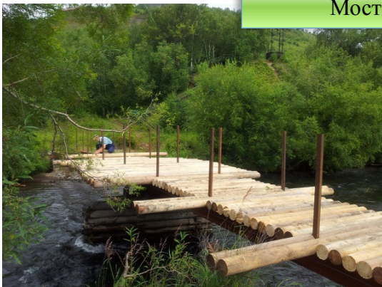
Мост к мемориалу

В селе Эссо Быстринского муниципального района реконструирован мост к мемориалу «Воинам-быстринцам, погибшим в годы Великой Отечественной войны».