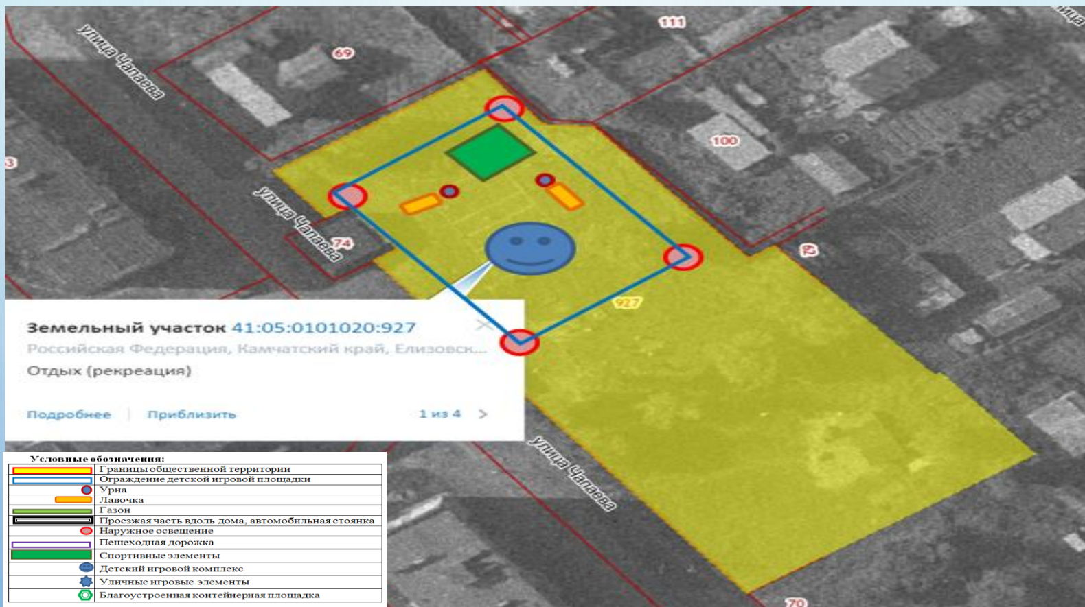
Схема земельного участка общественной территории: Детская площадка Новолесновского сельского поселения