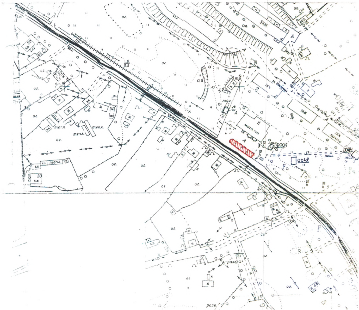
СХЕМА размещения временных объектов на территории Новоавачинского сельского поселения п. Нагорный