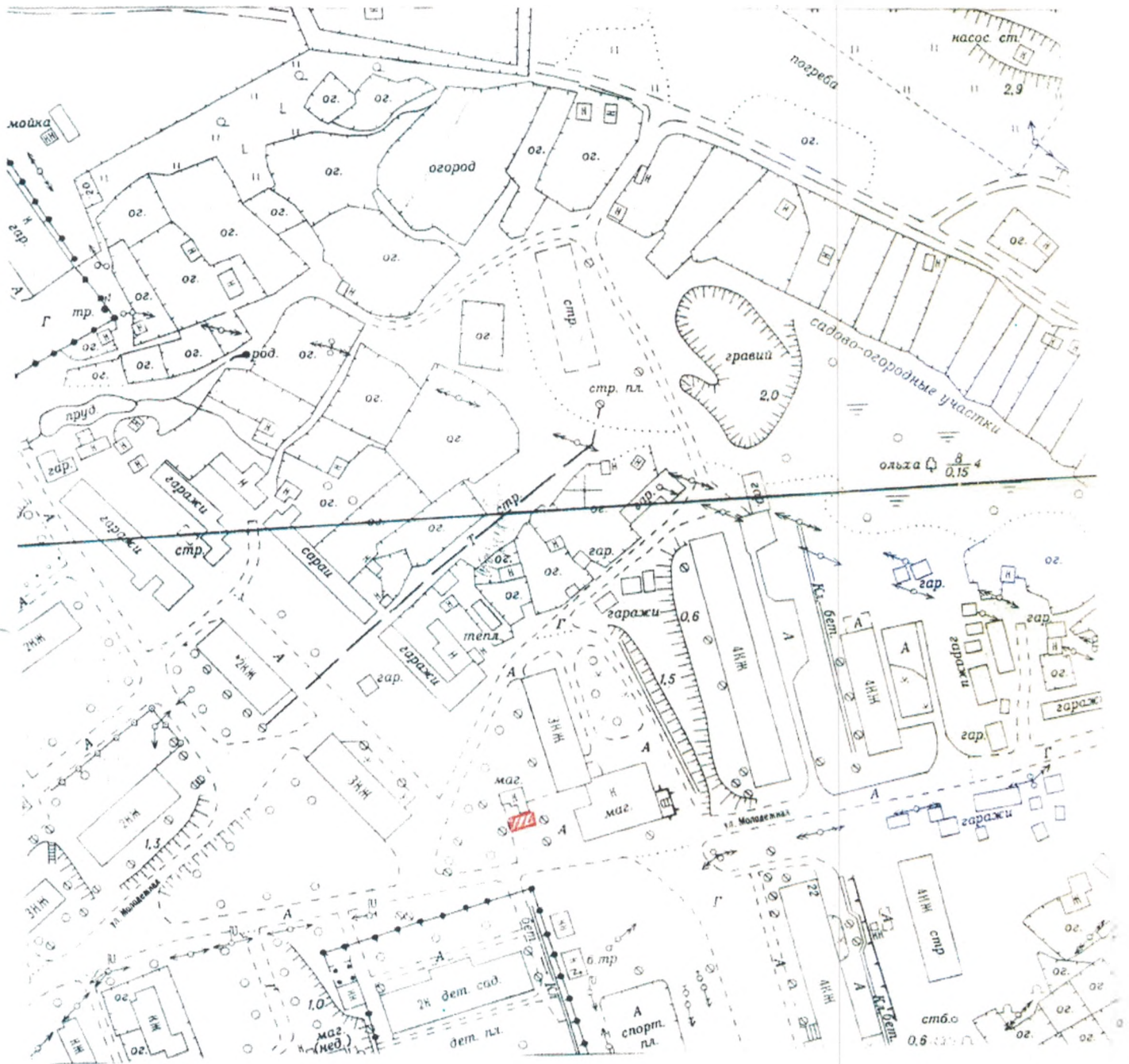
СХЕМА размещения временных объектов на территории Новоавачинского сельского поселения п. Новый

Приложение № 1 к Постановлению главы Новоавачинского сельского поселения от 6.07.2010 № 43