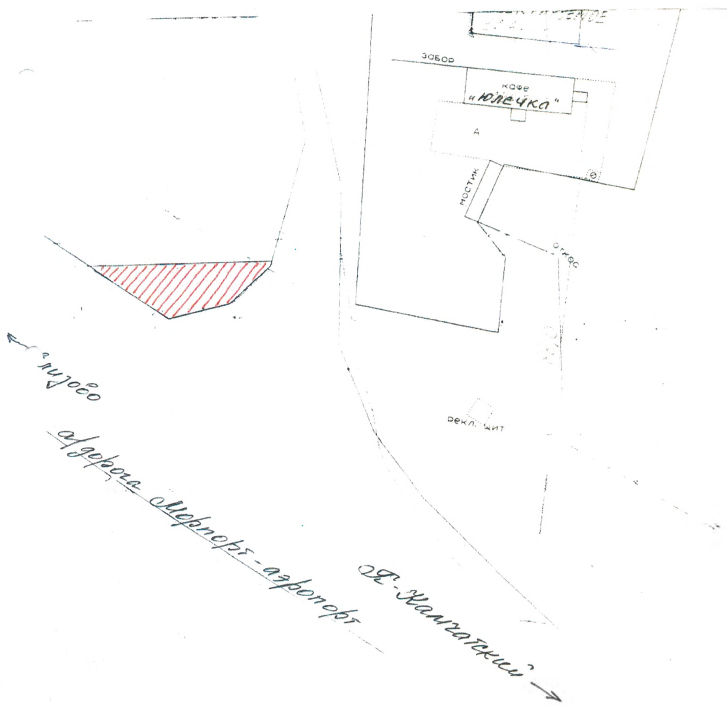
СХЕМА размещения временных объектов на территории Новоавачинского сельского поселения район 16(18) км автодороги Морпорт -аэропорт

Приложение №1 к Постановлению главы Новоавачинского сельского поселения от 6.07.2010 № 43