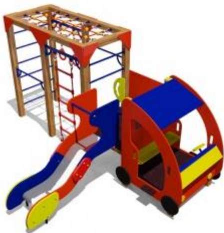
Игровой комплекс(2-4 года)