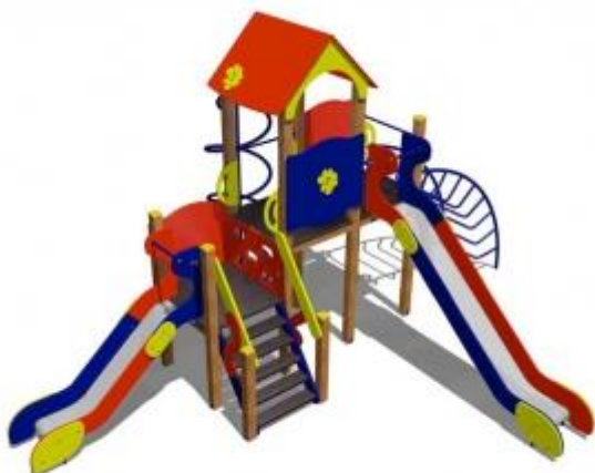
Игровой комплекс (4-6 лет)