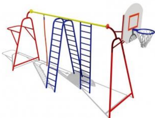
- Детский спортивный комплекс