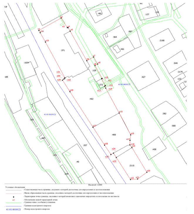
Приложение 2 к приказу Службы охраны объектов культурного наследия Камчатского края от «25» марта 2020 года №99