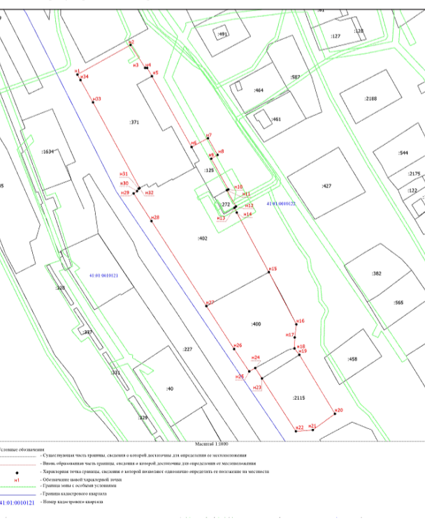
Приложение 2 к приказу Службы охраны объектов культурного наследия Камчатского края от «24» января 2020 года №2