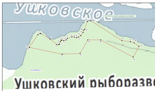
Приложение 2 к приказу Службы охраны объектов культурного наследия Камчатского края от 09.06.2020 года №23

Режим использования территории объекта культурного наследия федерального значения «Ушковская стоянка», эпоха палеолита и неолита, расположенного по адресу (местонахождение): Камчатский край, Усть-Камчатский район