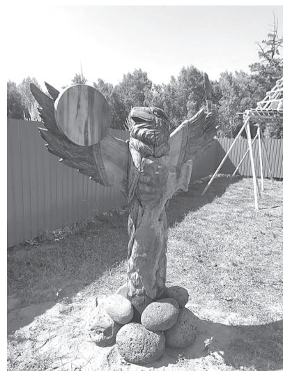
Автор работы Александр Дмитриев

Рядом с поселком Козыревск, в 18 км, расположена древнепалеоли-